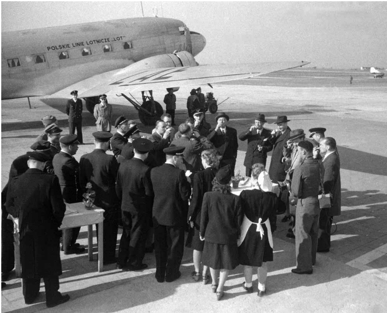
[A] Otwarcie linii lotniczej Warszawa–Budapeszt, w tle Lisunow Li-2p. Port Lotniczy Warszawa-Okęcie, maj 1948 roku

wyborów i tak jest już znany. Komuniści muszą wygrać. Ważne, by frekwencja była jak największa. 3 lutego 1947 roku Państwowa Komisja Wyborcza informuje, że na listę Bloku Demokratycznego, tworzonego przez partie komunistyczne: Polską Partię Robotniczą (PPR), Polską Partię Socjalistyczną (PPS), Stronnictwo Demokratyczne (SD) i Stronnictwo Ludowe (SL), oddano 80,1 procent głosów, na demokratyczne Polskie Stronnictwo Ludowe (PSL) pod wodzą Stanisława Mikołajczyka – 10,3 procent. Do urn poszło 89,9 procent uprawnionych. Wyniki wyborów przyspieszają trwający przez kolejne czterdzieści lat proces monopolizacji rządów przez komunistów.