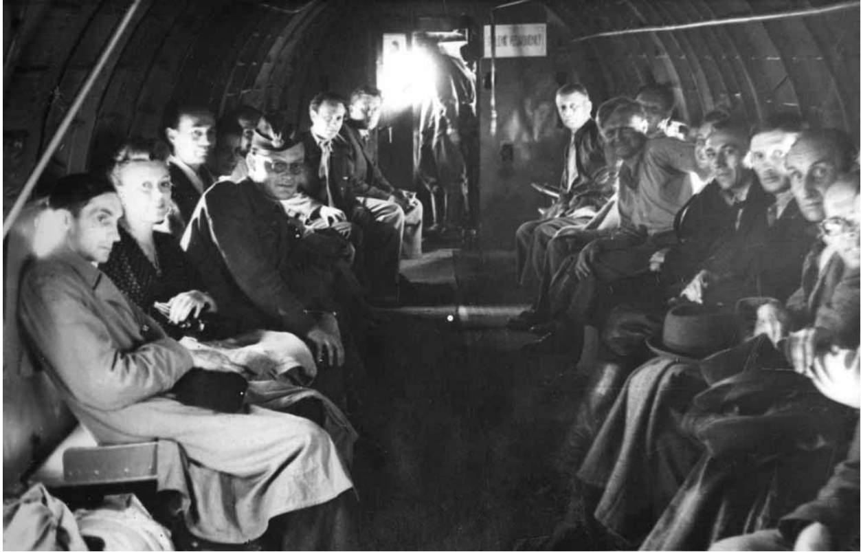
[^] Samoloty Lisunow Li-2r były maszynami transportowymi przystosowanymi do przewozu pasażerów. Podróżni siedzieli na blaszanych ławkach umieszczonych wzdłuż ścian. Nie mieli pasów bezpieczeństwa. Zdjęcie z 1945 roku