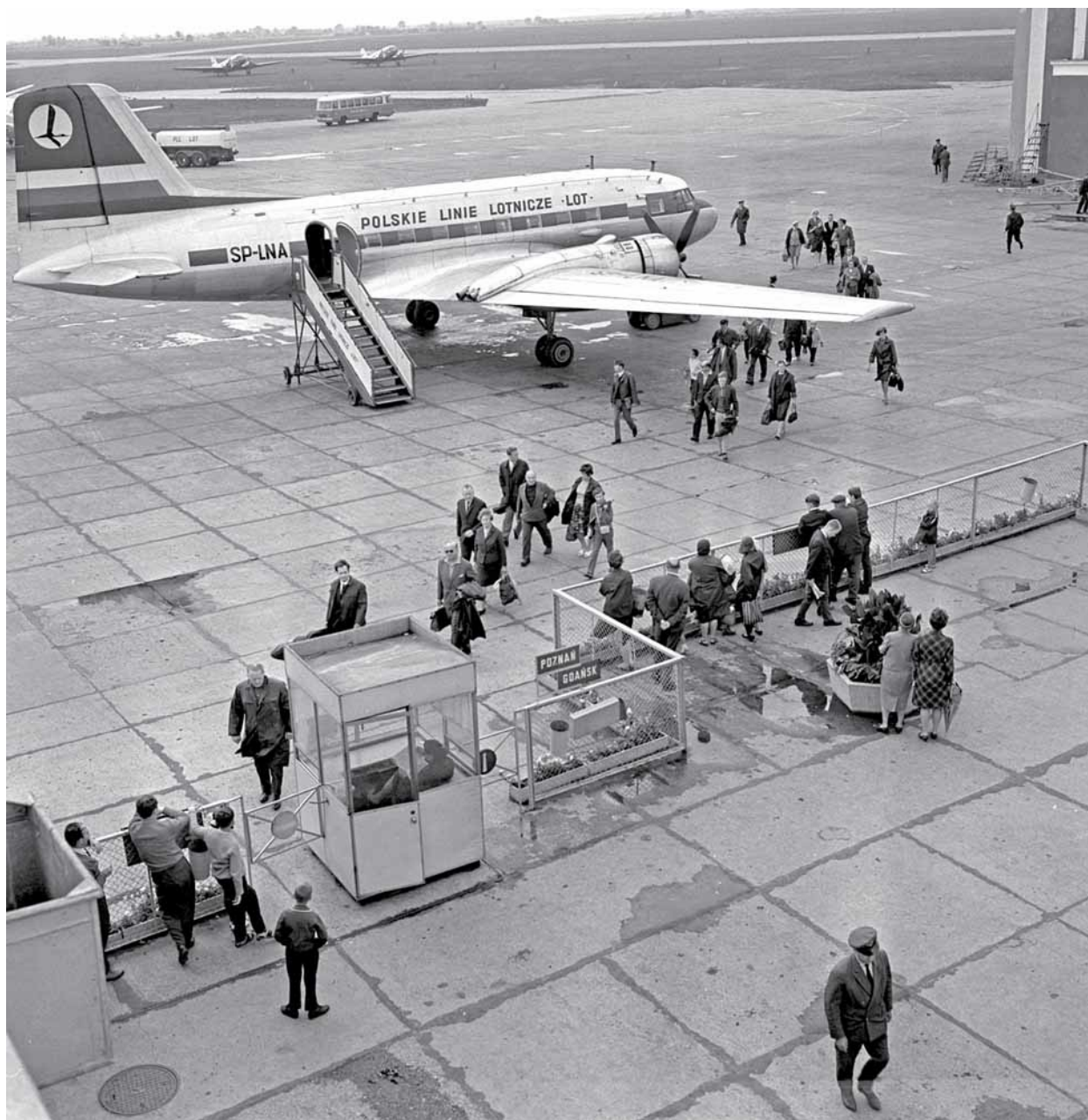
[A] Przejście graniczne na lotnisku Okęcie. 12 lipca 1966 roku

Wiedzą o tym także stewardesy. Ich kapciora mieści się w jednym z drewnianych baraków oddalonych kilka metrów od dworca głównego. W pokoju o powierzchni około trzydziestu metrów kwadratowych przebierają się, plotkują, w drewnianych szafkach trzymają mundury na zmianę, zimą ciepłe kozaki, bo do samolotu chodzi się w pantofelkach, korzystają z jednego, wspólnego telefonu, siadają na jednym z dwóch krzeseł lub na małej kanapie, ręce myją w jednej jedynej umywalce. Jeśli chce im się