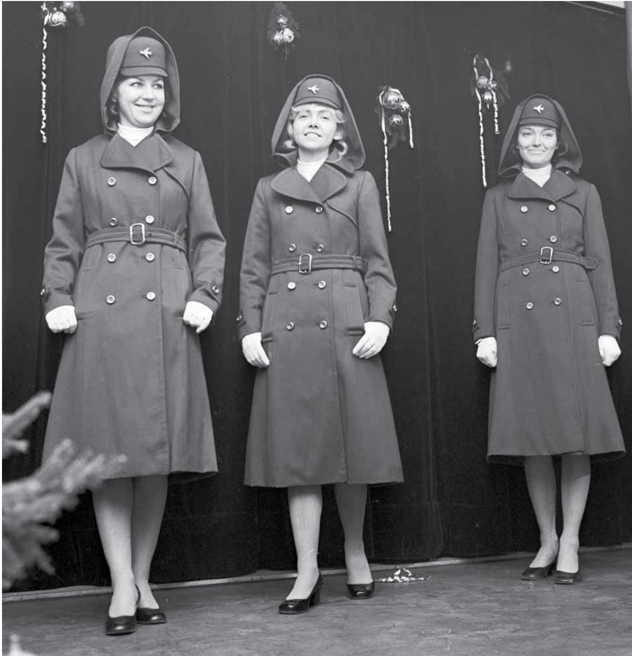
[A] Nowe modele mundurów stewardes LOT-u zaprezentowane podczas konferencji 22 stycznia 1972 roku

Mody Polskiej i jedna z czołowych projektantek w PRL-u, która tworzyła uniformy dla LOT-u w drugiej połowie lat siedemdziesiątych, nie potrafi jednak powiedzieć, kiedy pojawił się podział na stroje letnie i zimowe. Opowiada natomiast, jak wyglądał proces ich powstawania.