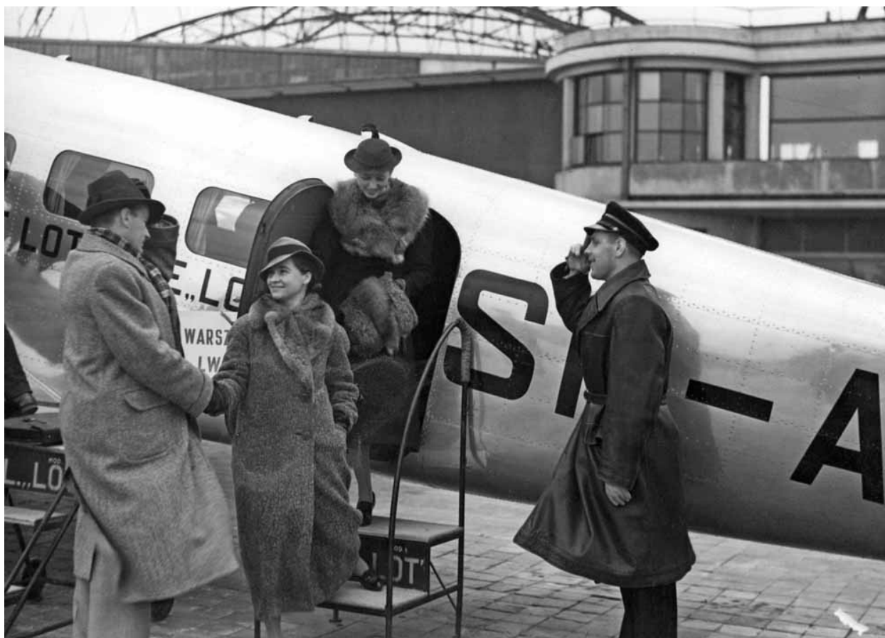
[A] Pasażerowie na lotnisku Warszawa-Okęcie. Na samolocie widać tabliczkę „Warszawa-Lwów”, w tle fragment budynku dworca lotniczego. Marzec 1937 roku

W 1935 roku LOT kupuje samoloty Douglas DC-2 – w każdym czternaście komfortowych miejsc. Nowe maszyny i wyższa jakość lotu potrzebują nowych standardów obsługi. Mechaników pokładowych, którzy czasami troszczą się o pasażerów, szkoli się więc w Szkole Przysposobienia Hotelarskiego przy Naczelnej Organizacji Przemysłu Hotelarskiego w Warszawie. Ostatnia grupa kończy zajęcia w Dniu Kobiet – 8 marca 1939 roku. O tym, by to kobiety zajmowały się pasażerami w czasie lotu, nikt jeszcze nie myśli [27] .