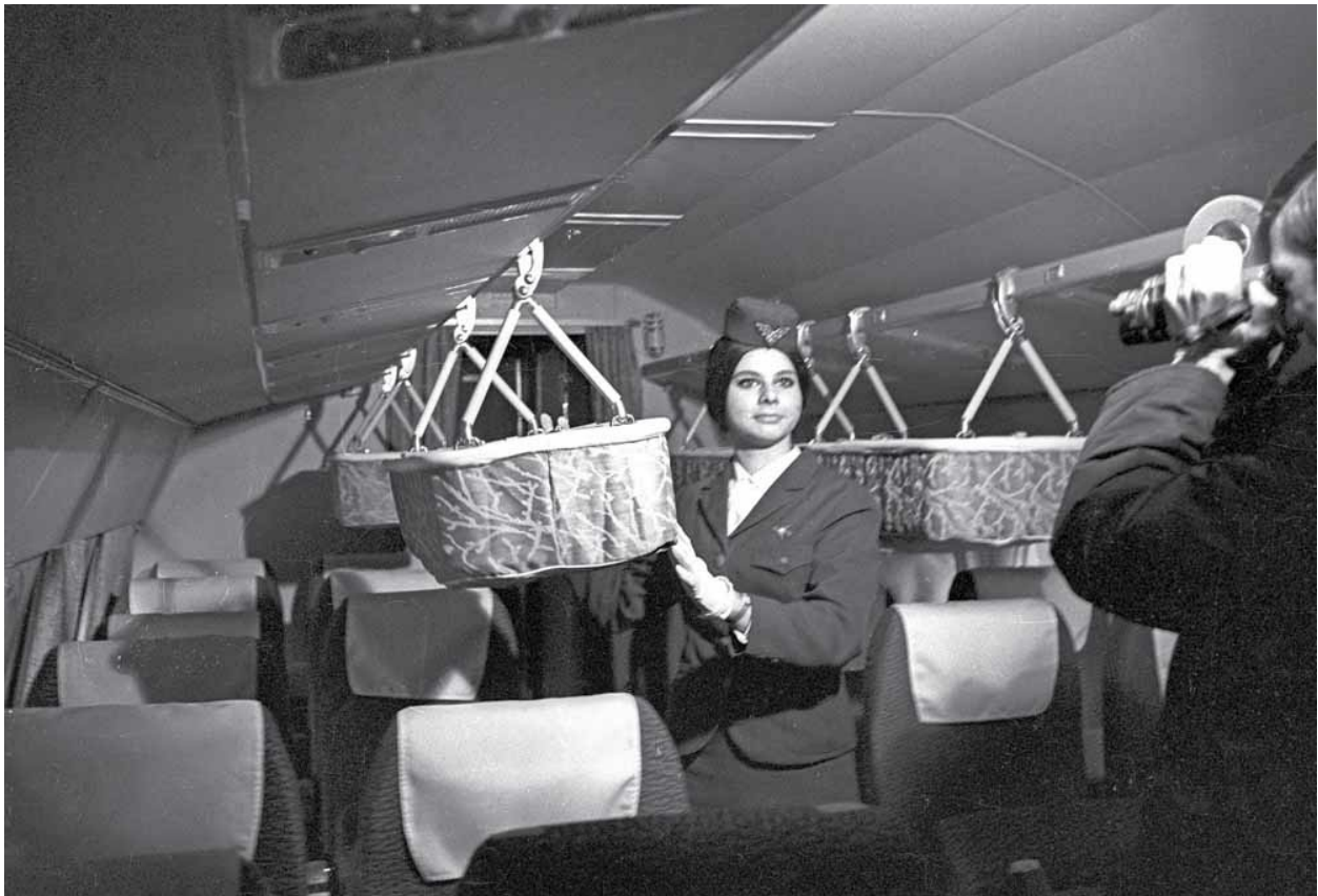
[94] Stewardesa obok kołyski we wnętrzu samolotu. 1969 rok

„Dzieci są bagażem specjalnego rodzaju [...] – pisze »Skrzydłata Polska«. – Jeśli zabieramy je ze sobą, wybierajmy do przelotów dni w środku tygodnia, kiedy samoloty są zwykle mniej zapełnione. Wskazane są oczywiście raczej loty dzienne niż nocne. Wybierać należy połączenia bezpośrednie, bez uciążliwych przesiadek. Starajmy się, by nasze dzieci zachowywały się na pokładzie nie bardziej absorbująco niż dorośli. Utrzymujmy je na miejscu w czasie posiłków, by nie przeszkadzały stewardesom. Jedzmy posiłek przed dziećmi, by móc im w razie czego pomóc. Nie dawajmy na pokładzie dzieciom zabawek, którymi mogłyby zakłócić spokój innych podróżnych. [...] Na podróż ubierajmy dzieci pod kątem wygody, nie reprezentacji” [94] .