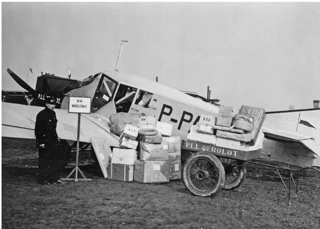
[A] Poczta do Warszawy. PLL Aerolot. Samolot Junkers F-13. 1928 rok