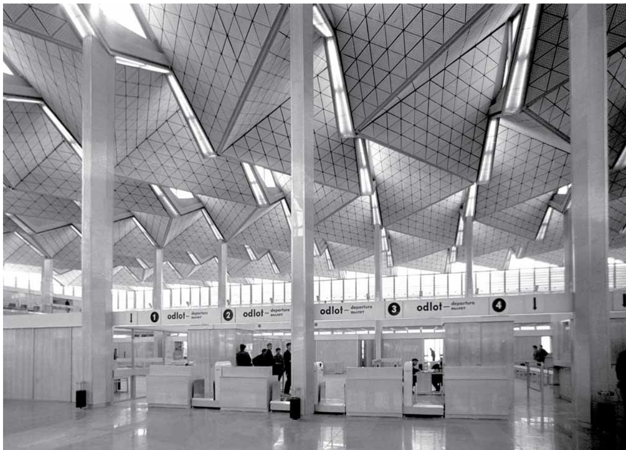
[A] Nowo otwarty Międzynarodowy Dworzec Lotniczy Okęcie. Widoczny charakterystyczny sufit. Maj 1969 roku

– To był fajny budynek, tylko za mały – twierdzi Paweł Czaplicki. – Mógłby stać na przykład w porcie lotniczym w Bydgoszczy albo w Rzeszowie. W Polsce mówiło się, że będzie miał przepustowość półtora miliona pasażerów rocznie, a do branżowej prasy francuskiej, która także zachwycała się obiektem, podawano dwa i pół miliona. Nie wiem, kto i jak to liczył, ale każda z tych liczb była wzięta z sufitu.