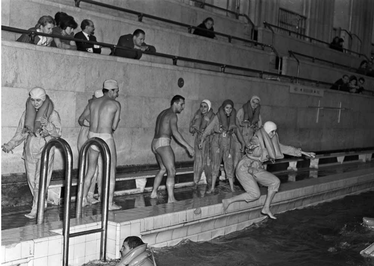
[A] Szkolenie stewardes w zakresie ratowania pasażerów, które przeprowadzono na pływalni w Pałacu Kultury i Nauki. 1966 rok