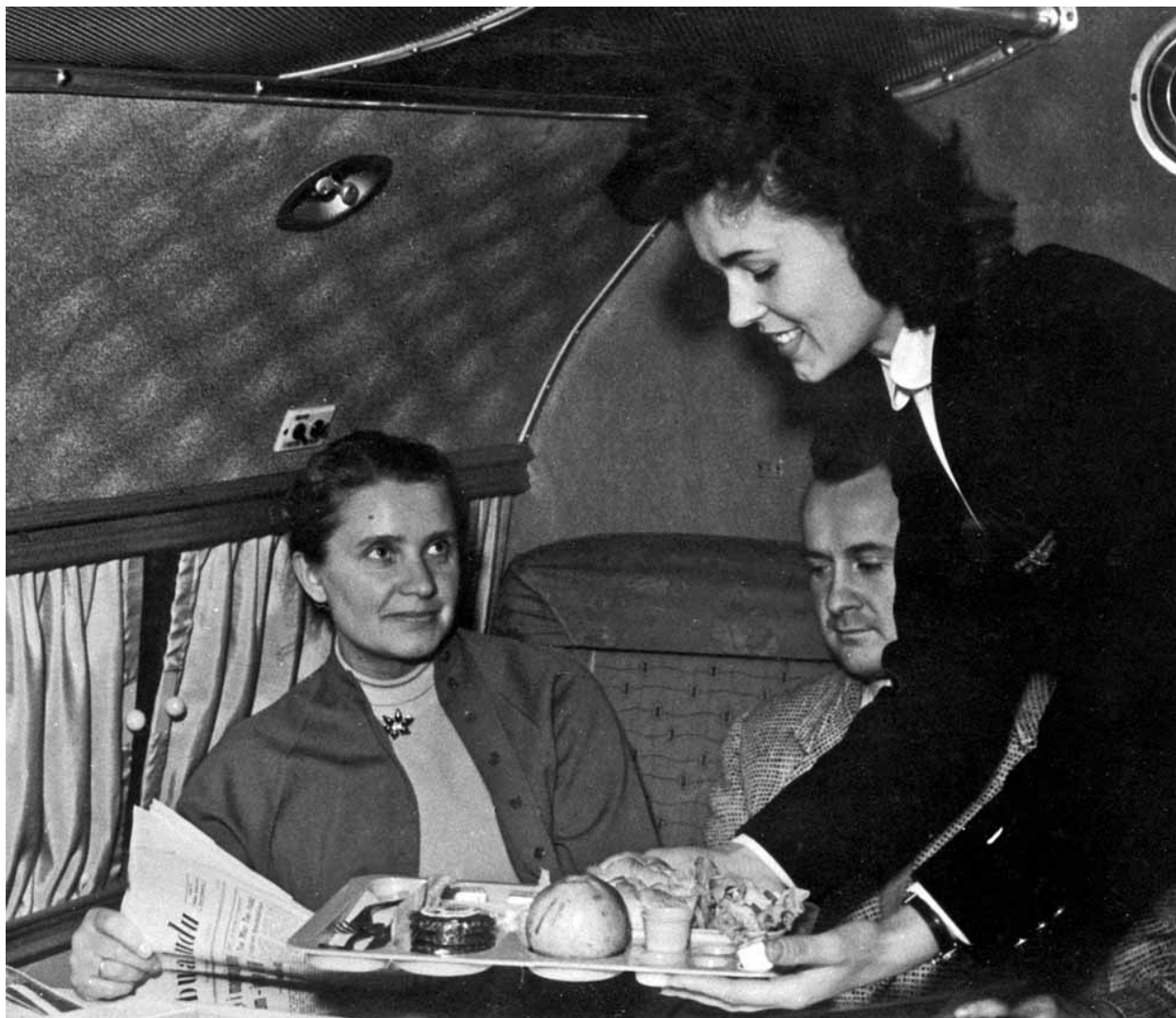
[^] Stewardesa serwująca posiłek w czasie lotu. 1957 rok