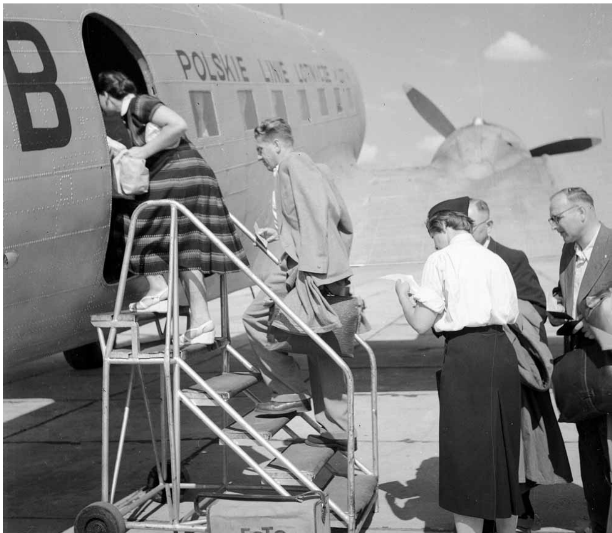
[^] Przygotowania samolotu do wylotu w Porcie Lotniczym Warszawa--Okęcie. Widoczna stewardesa kontrolująca bilety. 1955 rok

Ale już w 1957 roku LOT kupuje od belgijskich linii lotniczych trzy amerykańskie samoloty Convair, czyli swoje pierwsze maszyny z kabiną ciśnieniową, które zdecydowanie podnoszą komfort pracy i podróży, a także pozwalają na przewóz czterdziestu pasażerów [56] . Cztery lata później na linie średnie, czyli na przykład do Wiednia czy Aten, wchodzi pierwszy w polskiej komunikacji lotniczej samolot turbośmigłowy krótkiego zasięgu – Ił-18, który z czasem pozwoli powiększyć ofertę przewoźnika o loty do Kairu, Zagrzebia, Helsinek, Frankfurtu, Mediolanu, Bejrutu, Splitu i Shannon w Irlandii [57] . W Locie pracuje wówczas około dwudziestu stewardes.