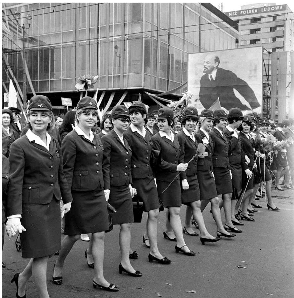
[A] Pochód pierwszomajowy, stewardesy. Warszawa, 1 maja 1968 roku