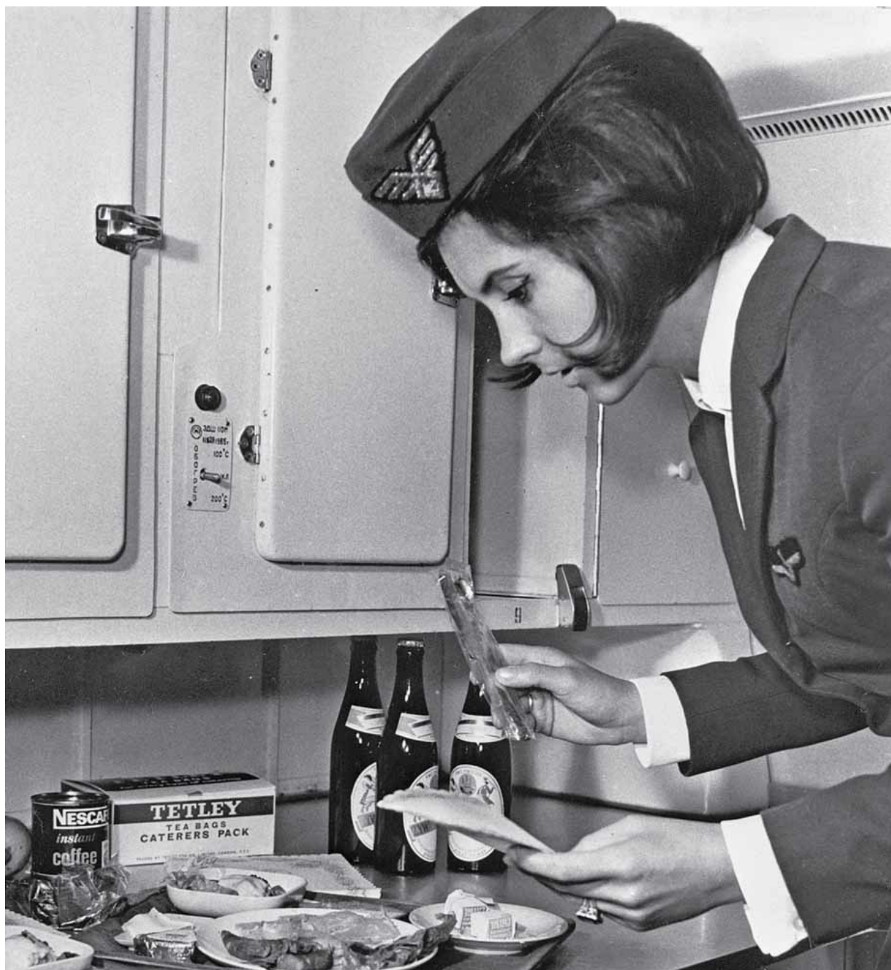
[A] Wnętrze lotowskiego samolotu Il-18. Przygotowanie posiłku. 1969 rok

„Rozpoznaję nobliwego pana ze zdjęcia, prowadził zajęcia, które składały się z teorii, a następnie praktyki na najwyższym piętrze Grand Hotelu, w restauracji Olimp. Były raczej przygotowaniem do obsługi pierwszej klasy pod kątem zasad eleganckiego serwisu (serwowanie potraw z półmisek, prawidłowe nakrycie stołu, serwowanie alkoholi, zasady przyrządzania